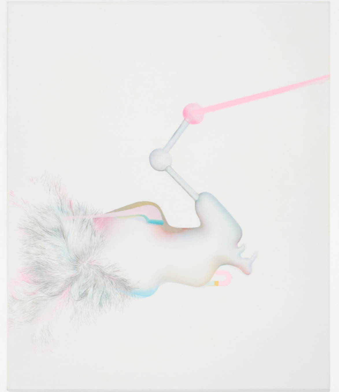
ORIGINS II, I, 2016, 50 x 60 cm, oil on canvas