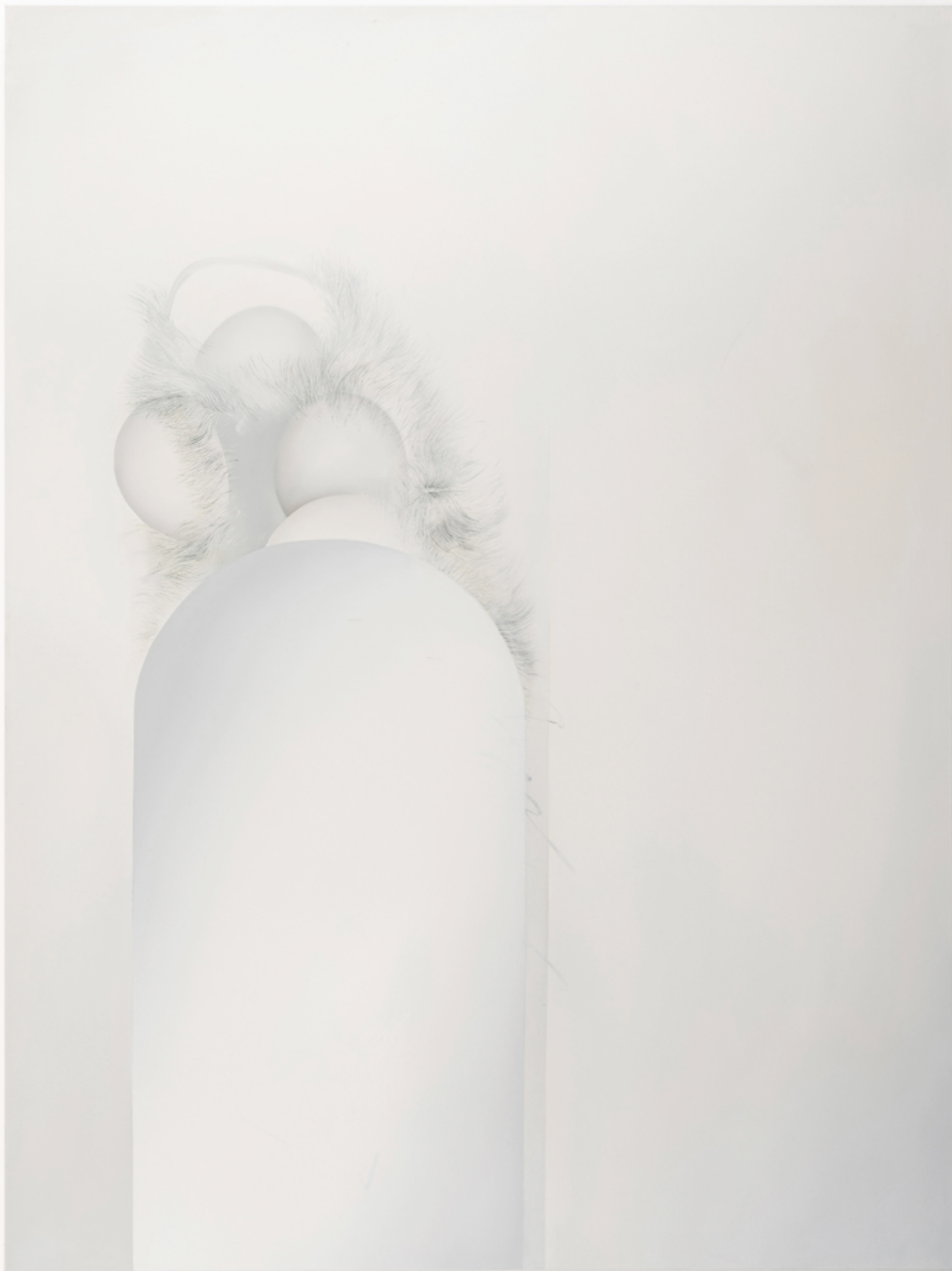
ZOON IX, 2023, 200 x 150 cm, oil on canvas