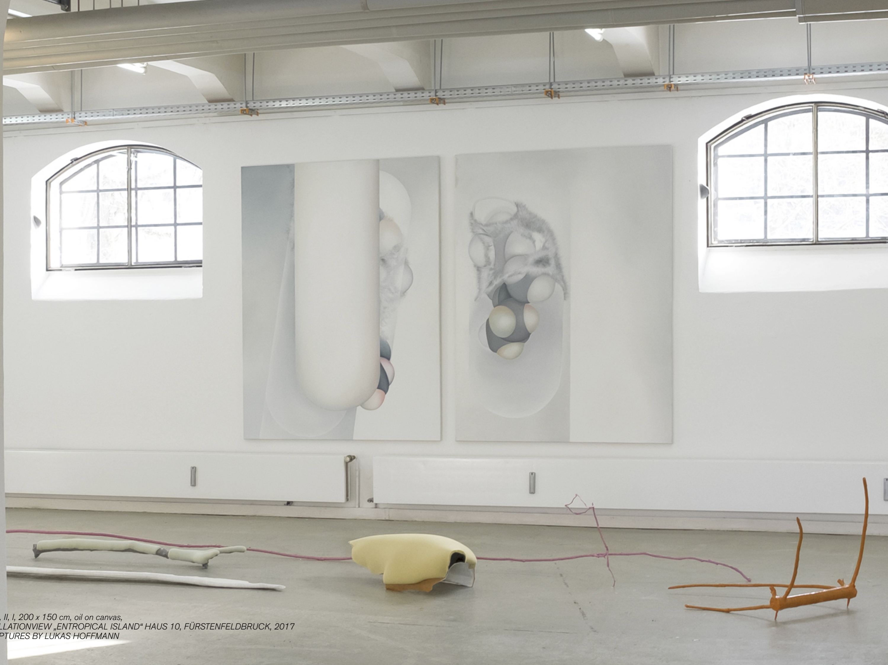
ZOON, II, I, 200 x 150 cm, oil on canvas, INSTALLATIONVIEW „ENTROPICAL ISLAND“ HAUS 10, FÜRSTENFELDBRUCK, 2017 SCULPTURES BY LUKAS HOFFMANN