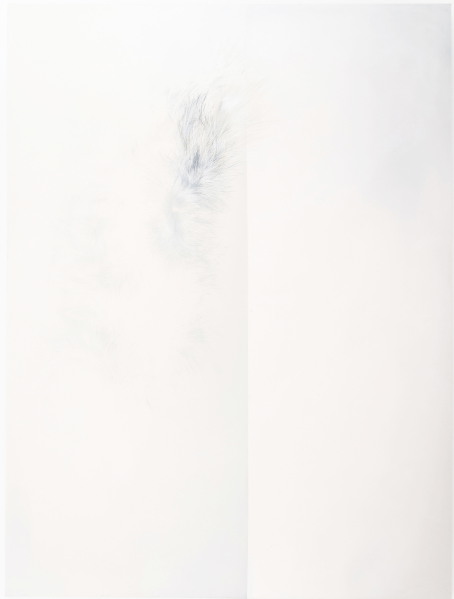
CREATION, 2023, 200 x 150 cm, oil on canvas