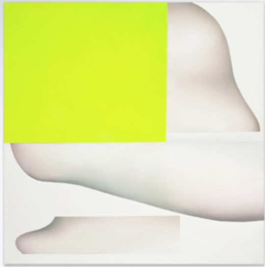
MORPHOGENESIS I, 2017, 140 x 140 cm, oil on canvas