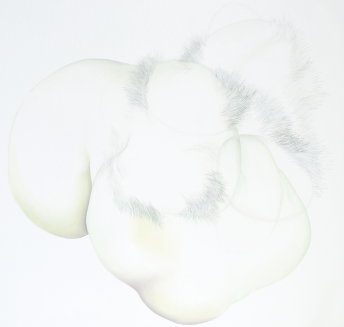
ZOON IV // EPHEMERAL EXISTENCE, 2013, 100 x 120 cm, oil on canvas VEGETARIANS ATE MY BABIES, 2013, 100 x 120 cm, oil on canvas