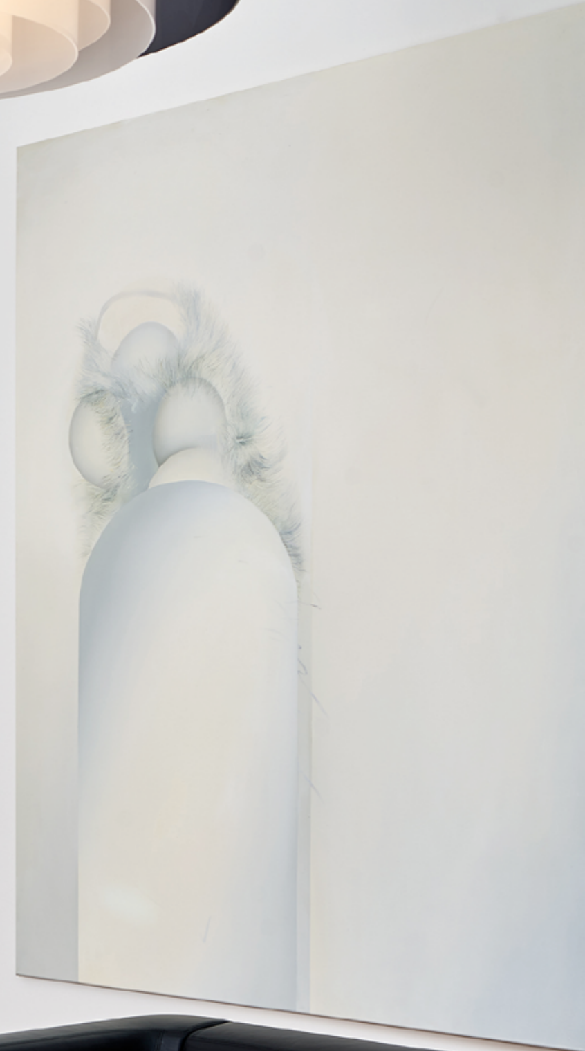
THEM, 2023, 150 x 200 cm, oil on canvas ZOON IX, 2023, 200 x 150 cm, oil on canvas CENTER FOR ADVANCED STUDIES /LMU MÜNCHEN