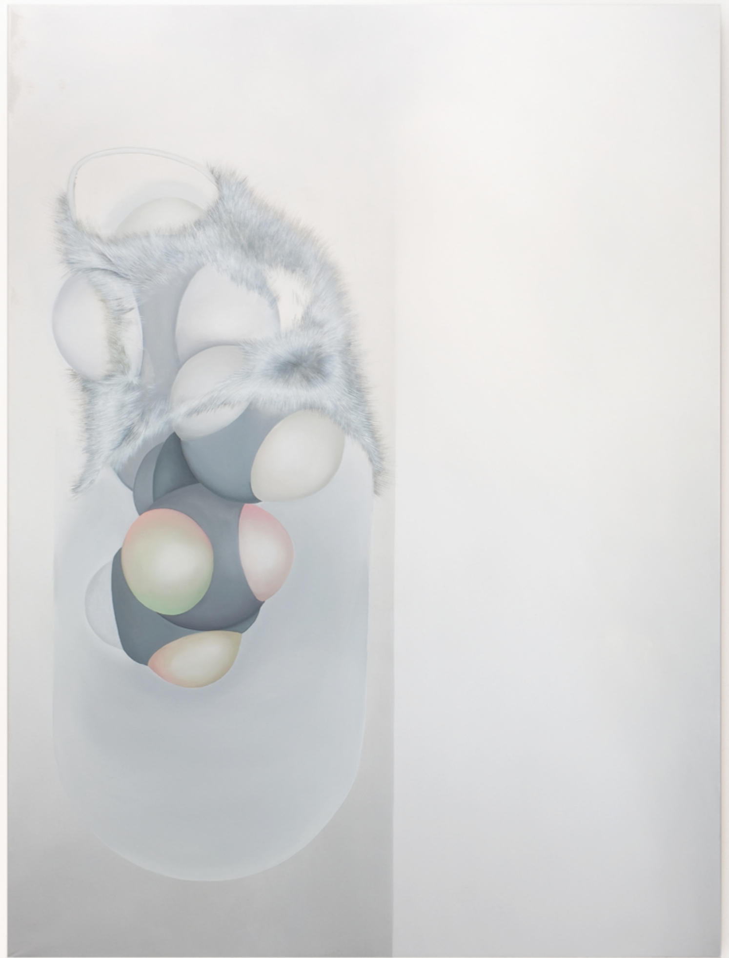
ZOON, II, I, 2014, 200 x 150 cm, oil on canvas